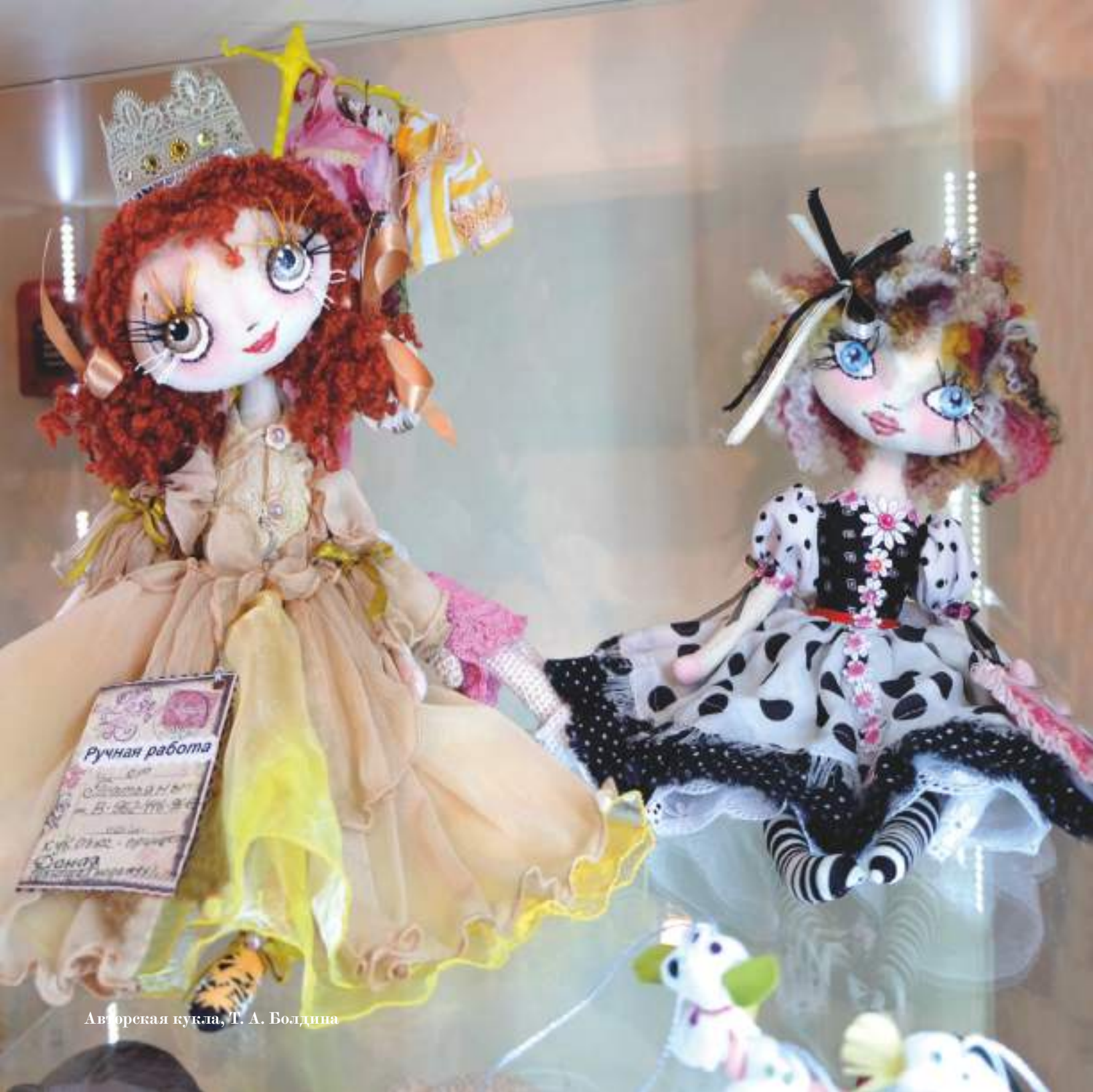
Авторская кукла, Т. А. Болдина