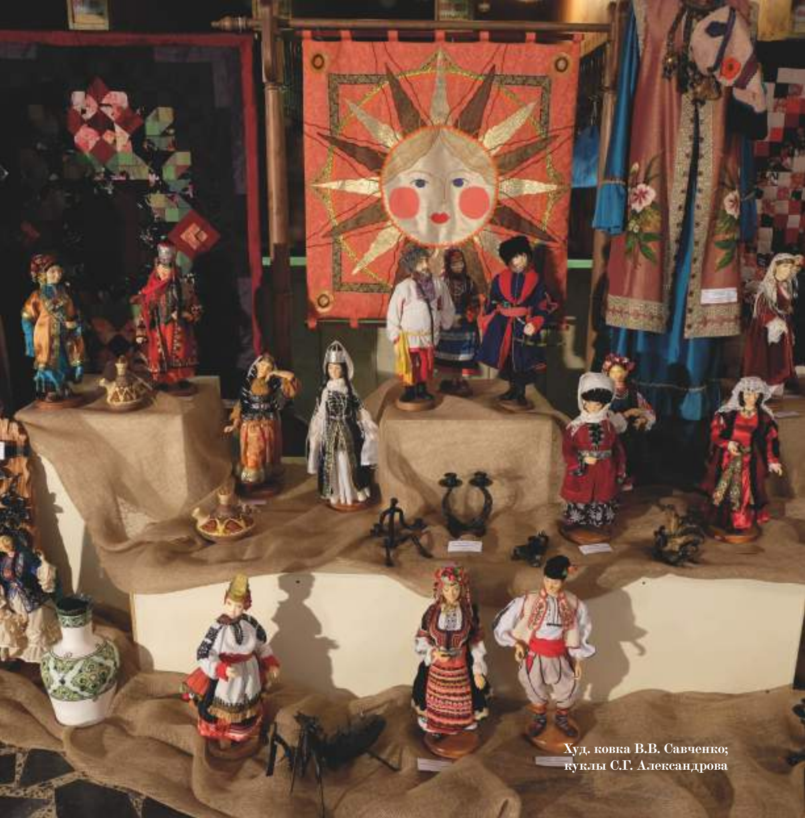
Худ. ковка В.В. Савченко; куклы С.Г. Александрова