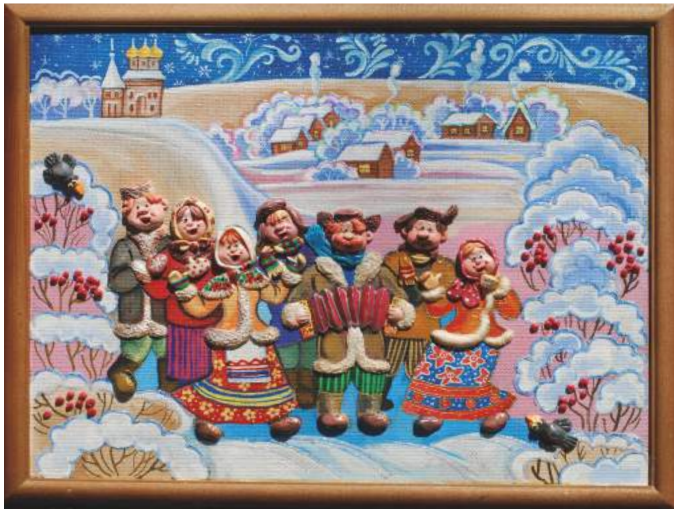
Панно «Рождественские гулянья»