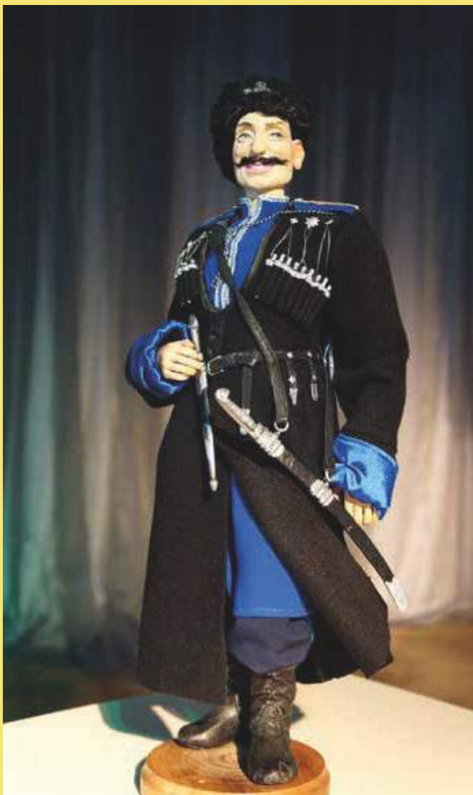
Кукла Терский казак. Общ.вид. Александрова С.Г.