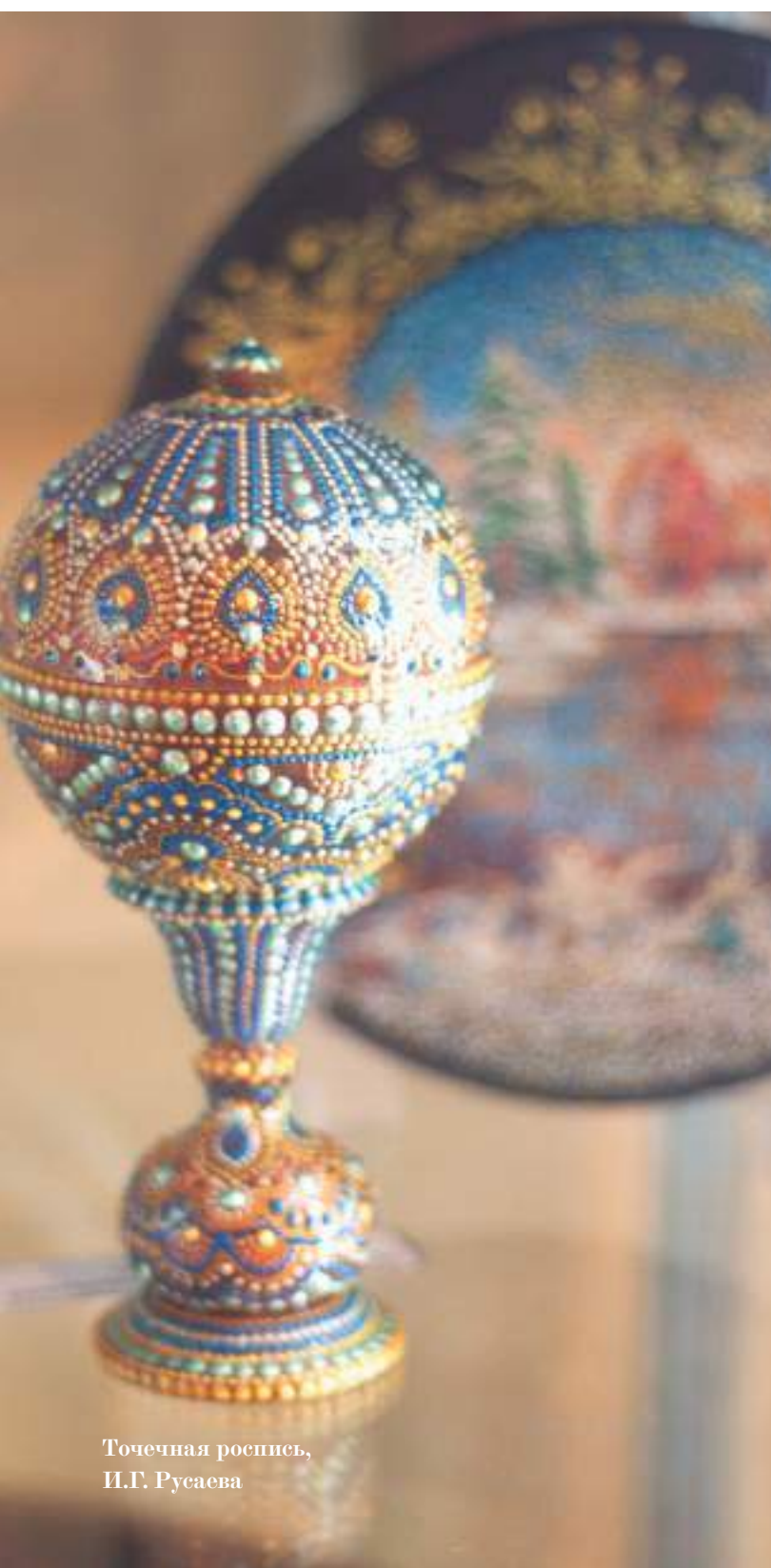
Точечная роспись, И.Г. Русаева