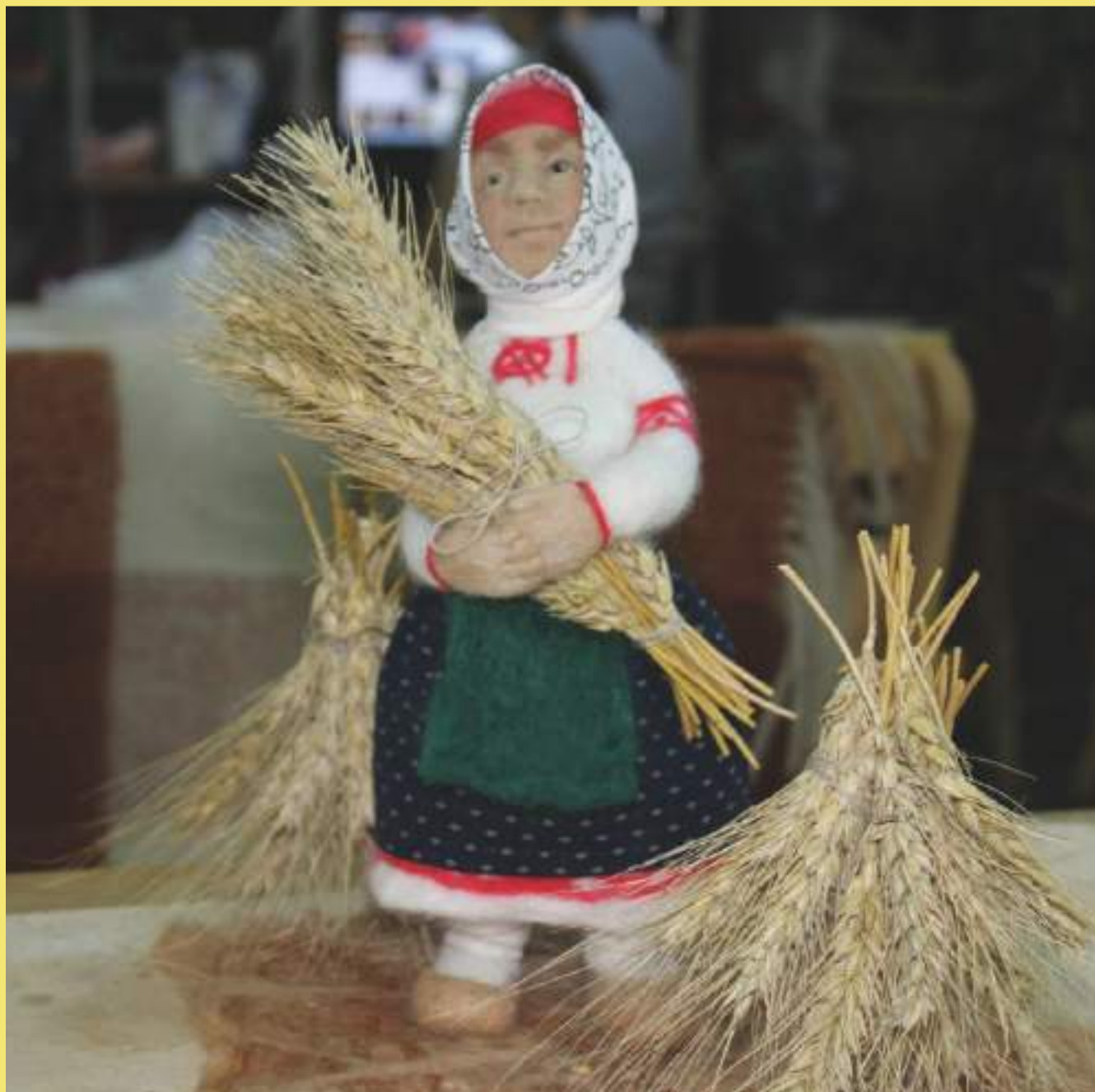
Войковаляние, «Крестьянка со снопом»