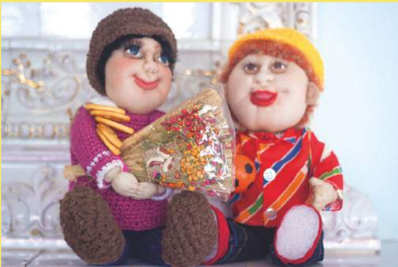
«Домовята», Т. Е. Мишустина