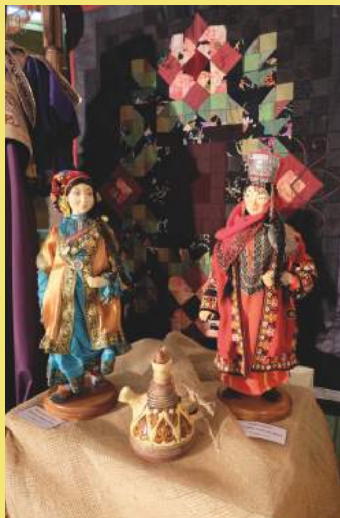
Авторские куклы, С. Т. Александрова