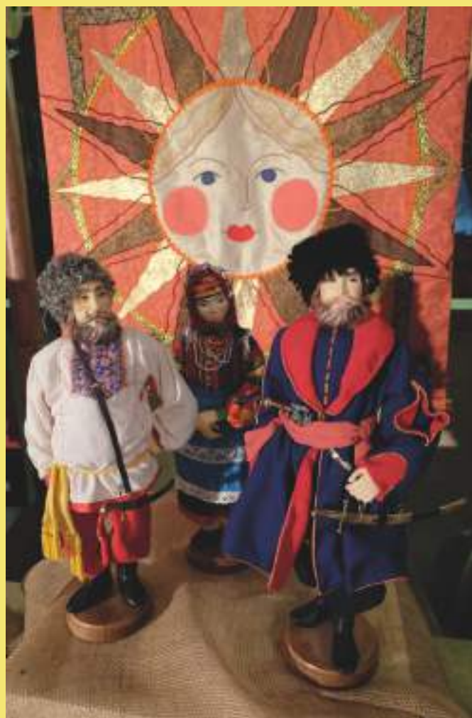
Авторские куклы, С. Т. Александрова