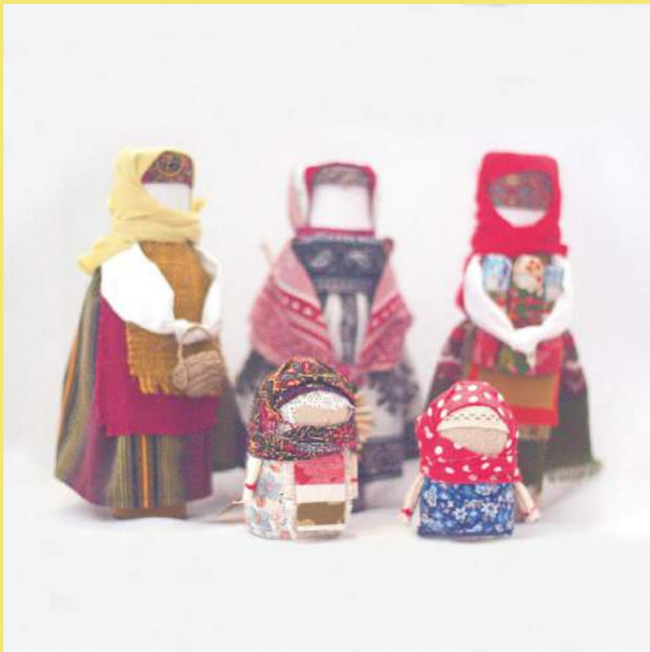
Куклы-обереги, И.И. Подлужная