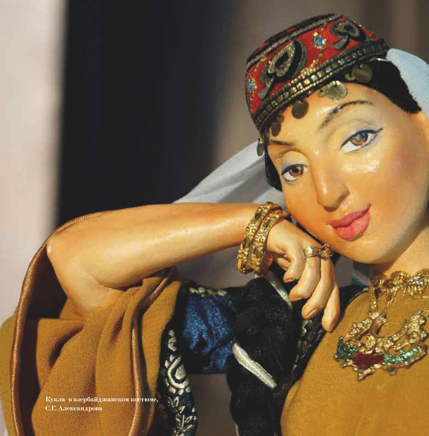
Кукла в азербайджанском костюме, С.Г. Александрова