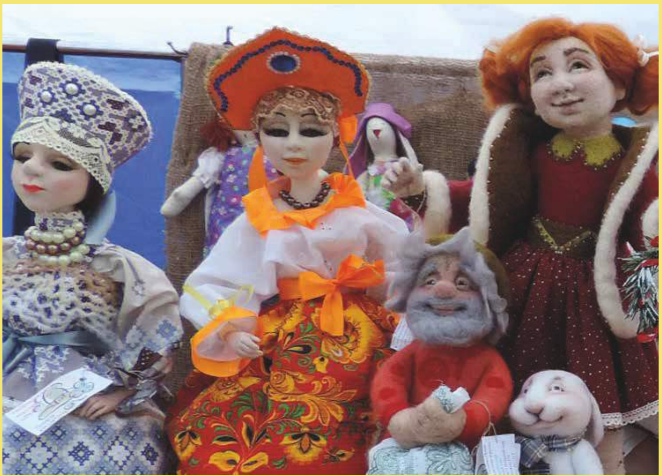
Работы И. Н. Москаленко и О. В. Митрофанова