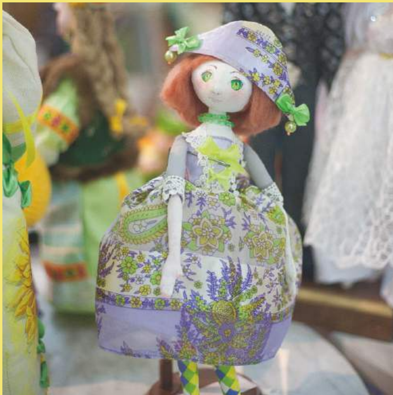
Авторская кукла, В.А. Микоелян