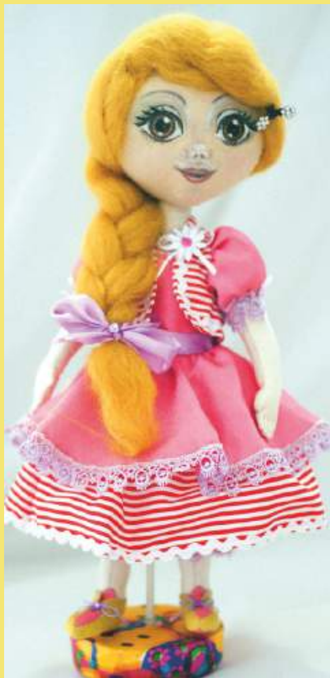
Авторская кукла, В. А. Микоелян