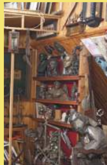
В «мастерской», художника