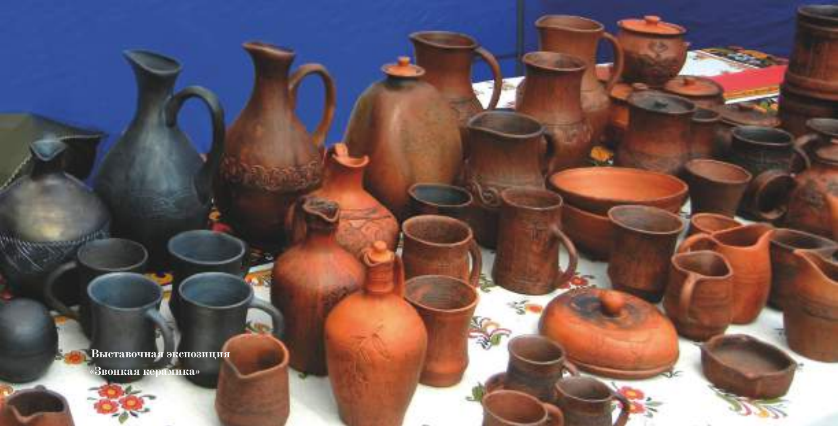
Выставочная экспозиция «Звонкая керамика»