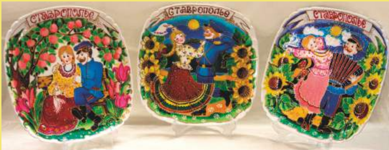
Витражная роспись тарели «Ставрополье»