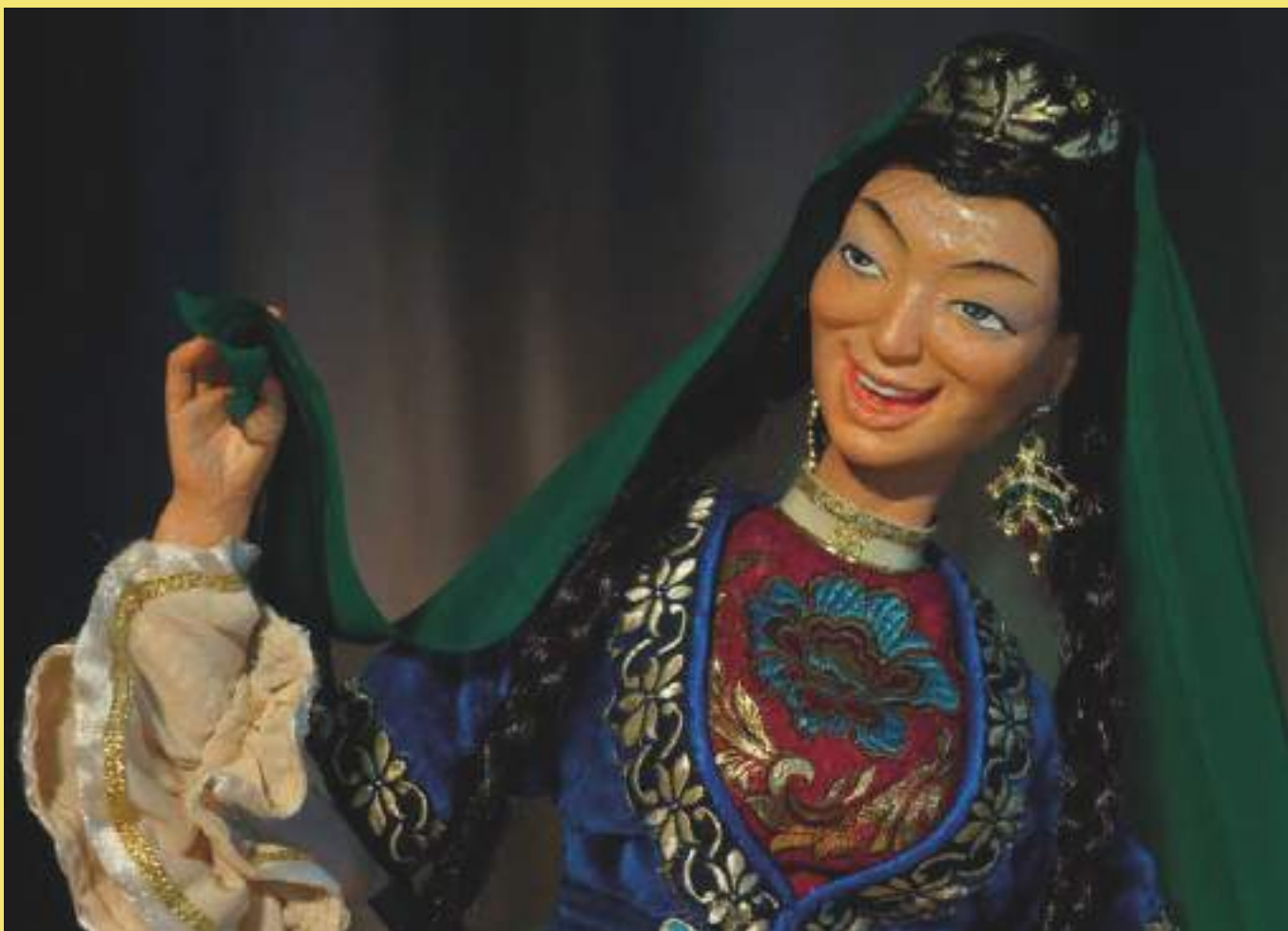
Кукла Татарка Мищары. Фрагмент. С. Г. Александрова