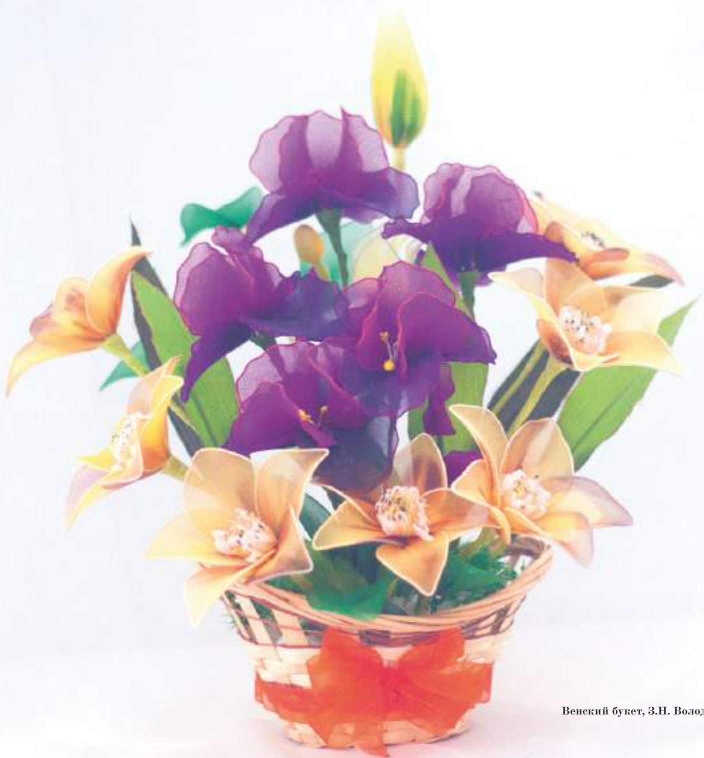
Венский букет, Э.Н. Володина