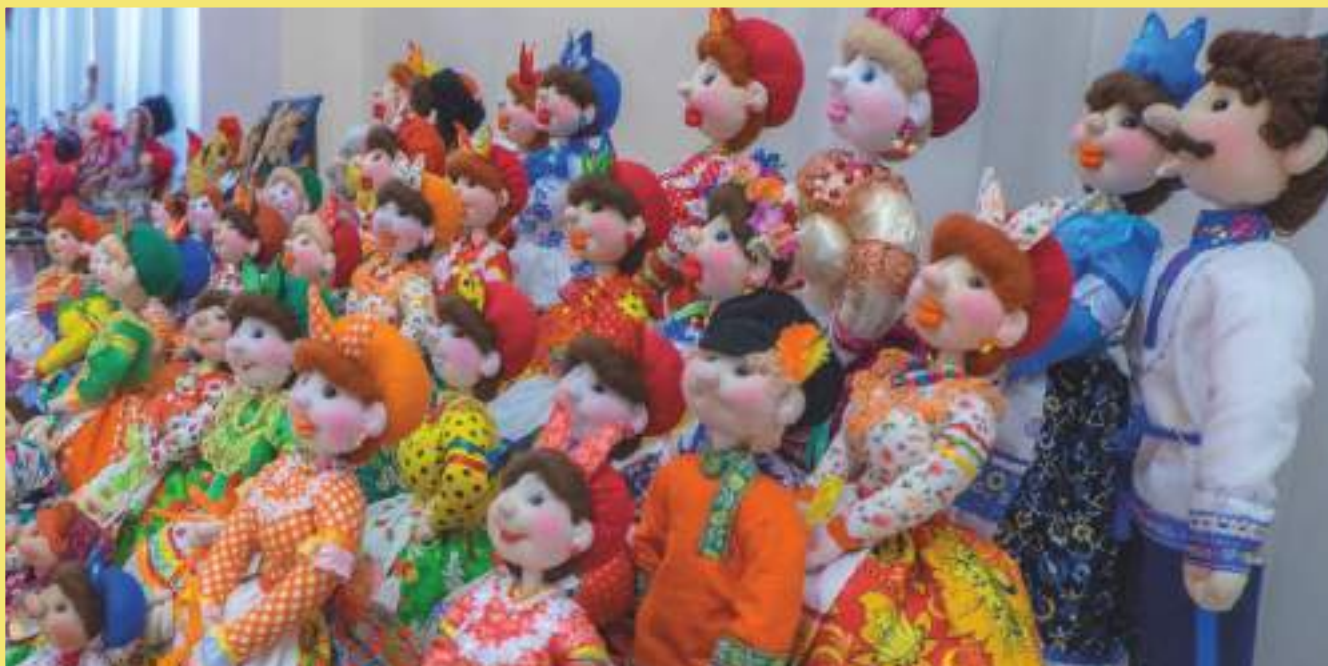
Выставочная экспозиция «Куклы-казачки»