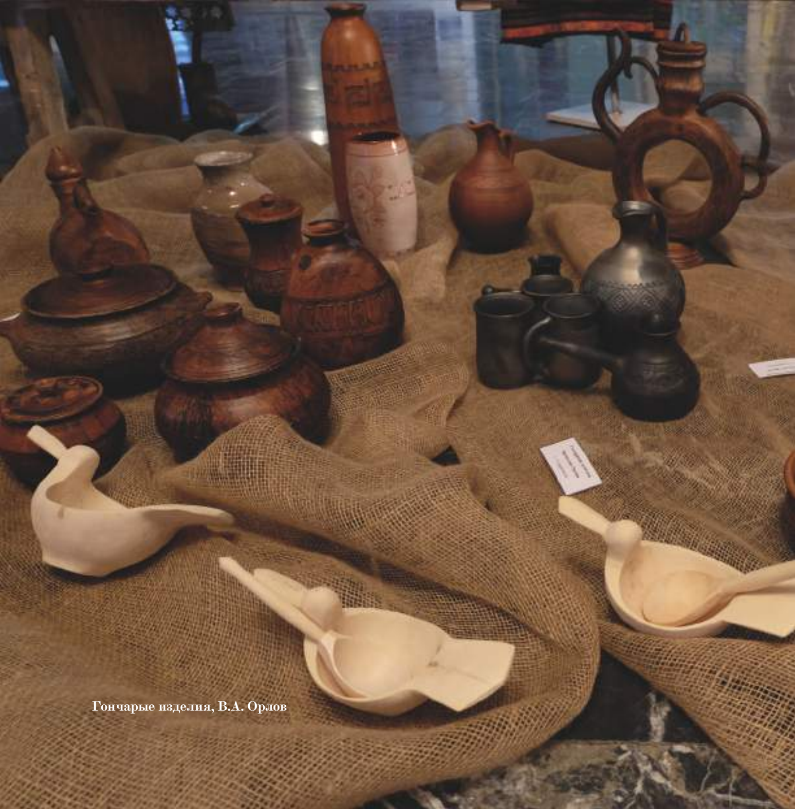
Гончарые изделия, В.А. Орлов