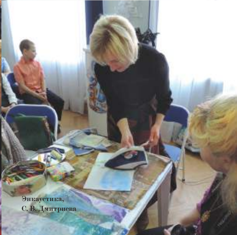
Энкаустика, С. В. Дмитриева