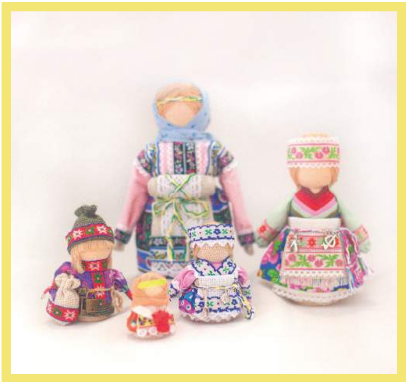
Куклы в народных костюмах, П.Р. Илюшкина