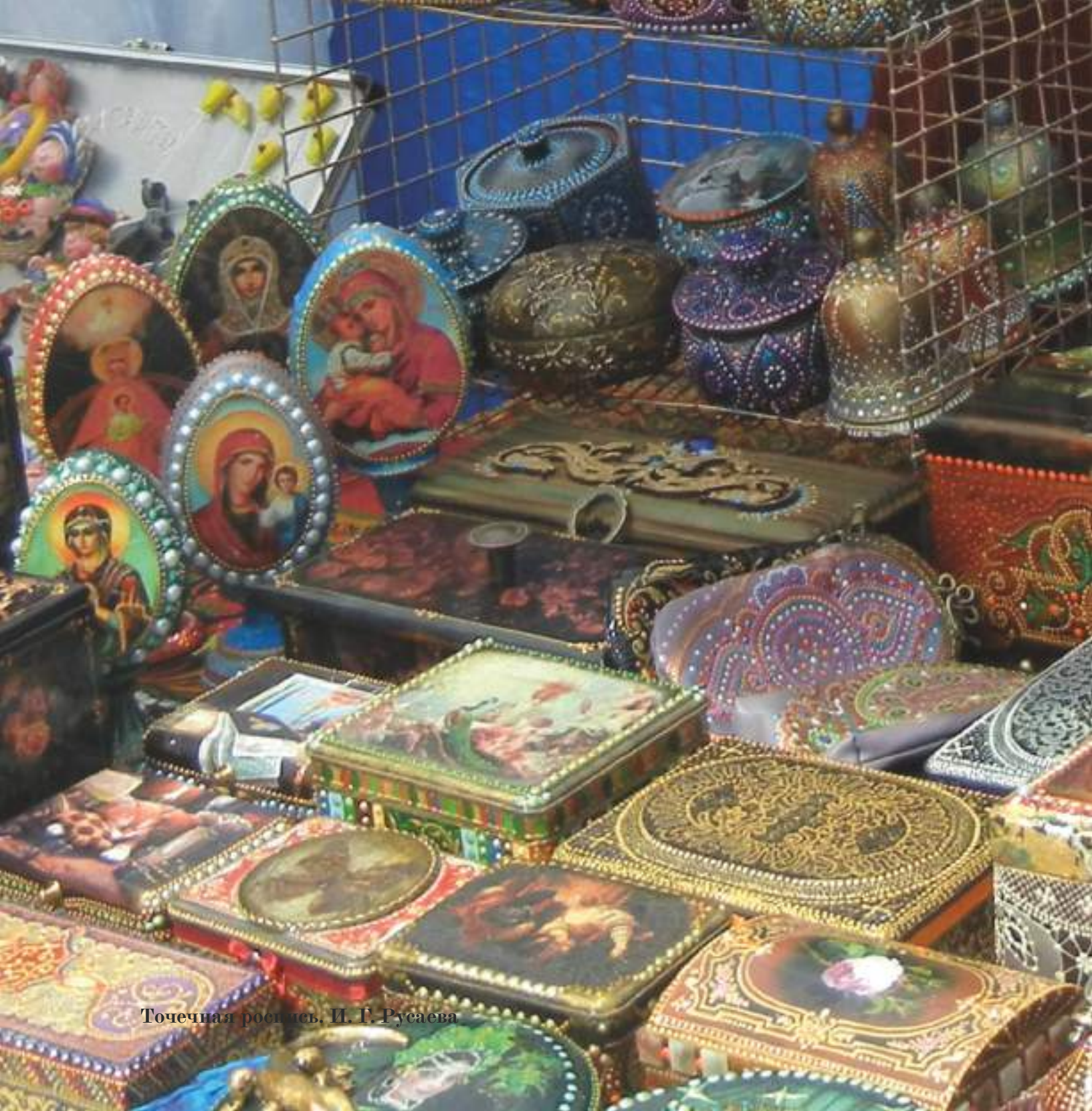
Точечная роспись, И. Г. Русаева