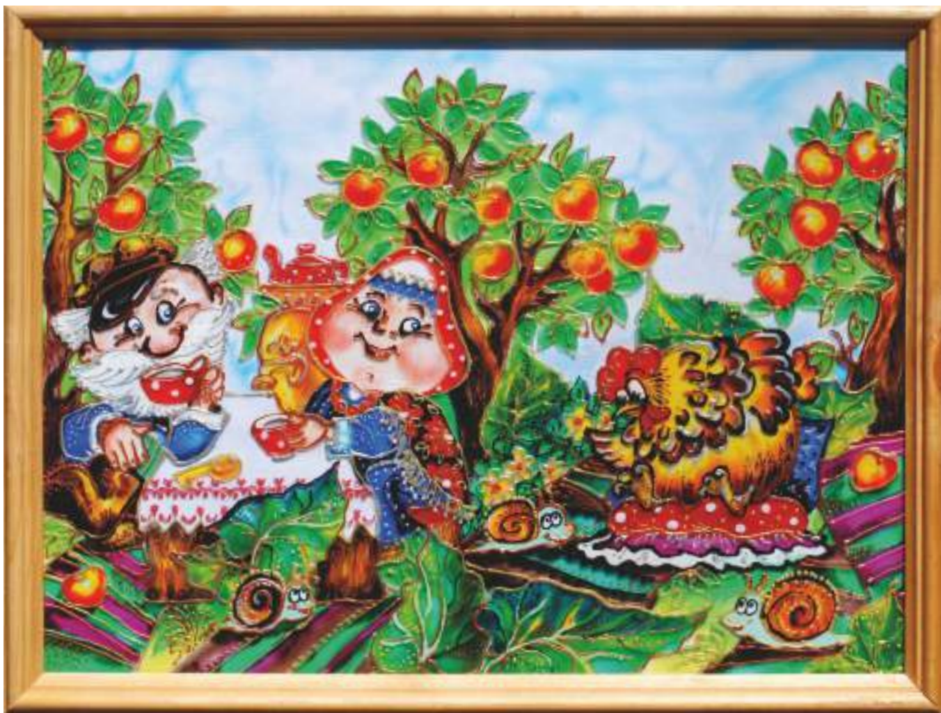
Витражная роспись «Сказка»