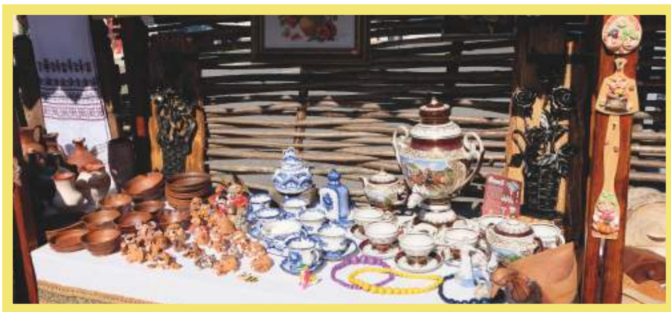
Кисловодский фарфор «Дельта-Х», керамика