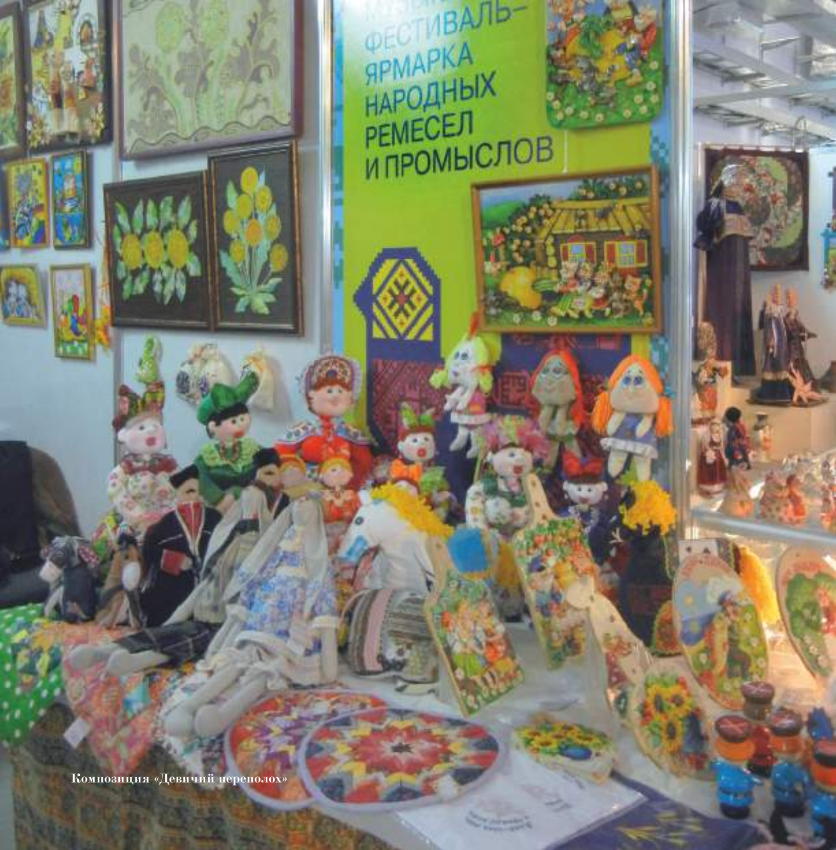
Композиция «Девичий переполах»