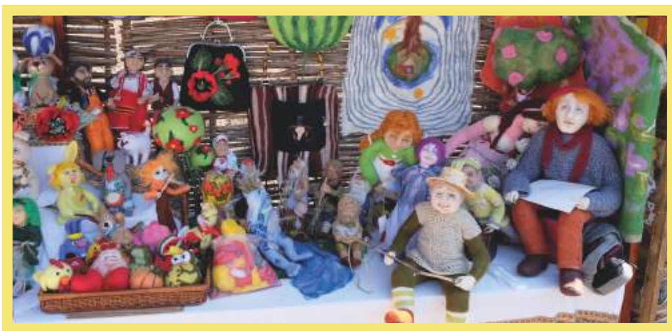
Изделия из войлока, И. И. Москаленко