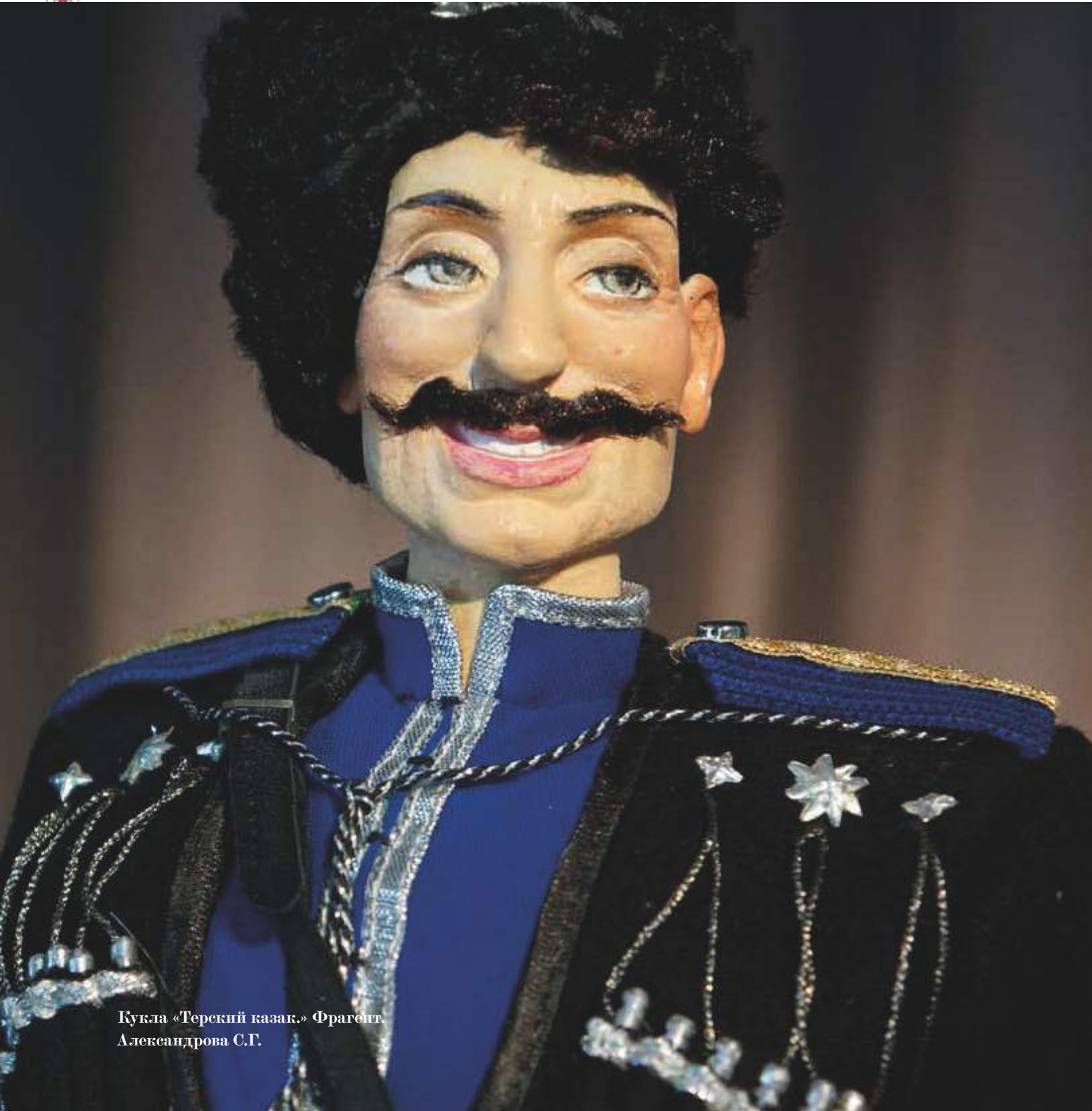
Кукла «Терский казак.» Фрагмент. Александрова С.Г.