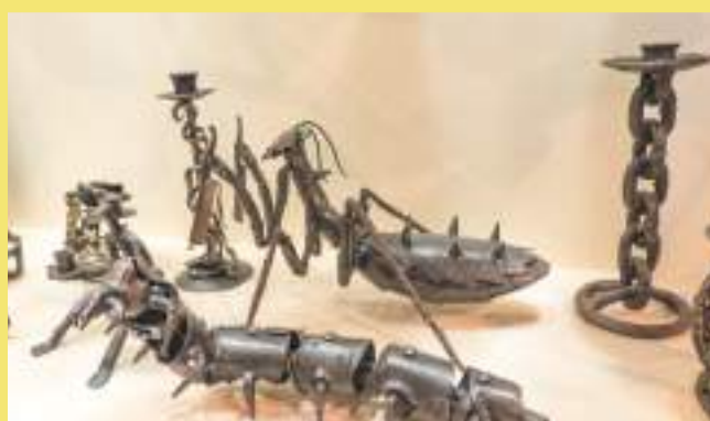
Композиция Савченко А.В. , Савченко И.В.