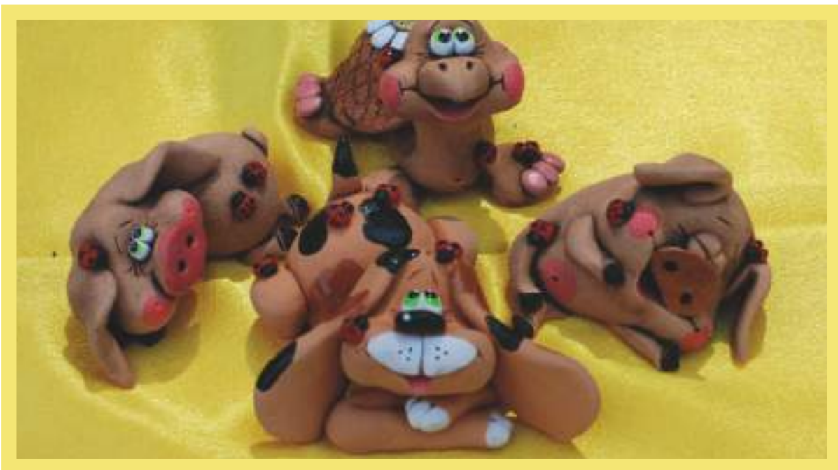
Керамика «Зверье мое»