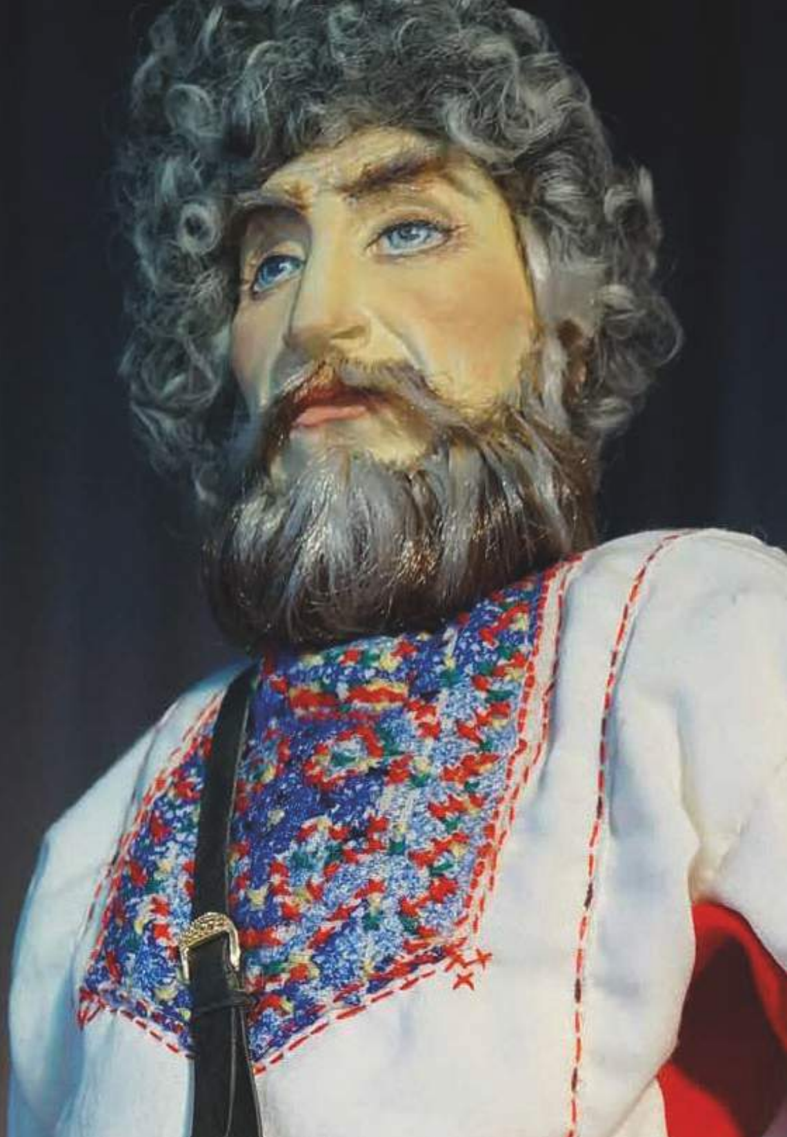
Кукла «Некрасовський казак.» Фрагмент. С.Г. Александрова