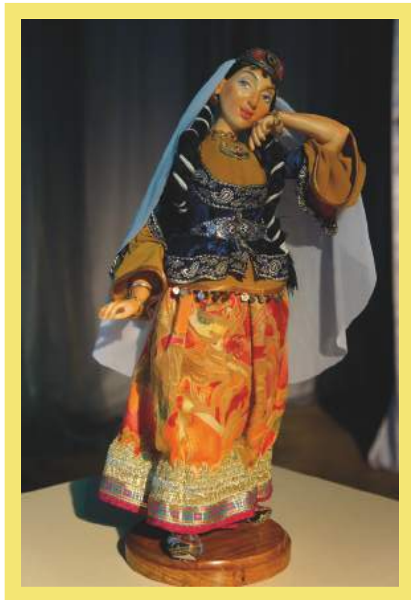
Кукла в азербайджанском костюме, С.Г. Александрова