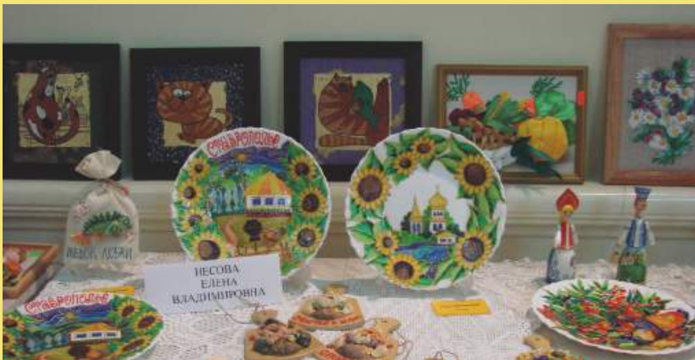
Витражная роспись тарели «Ставрополье»