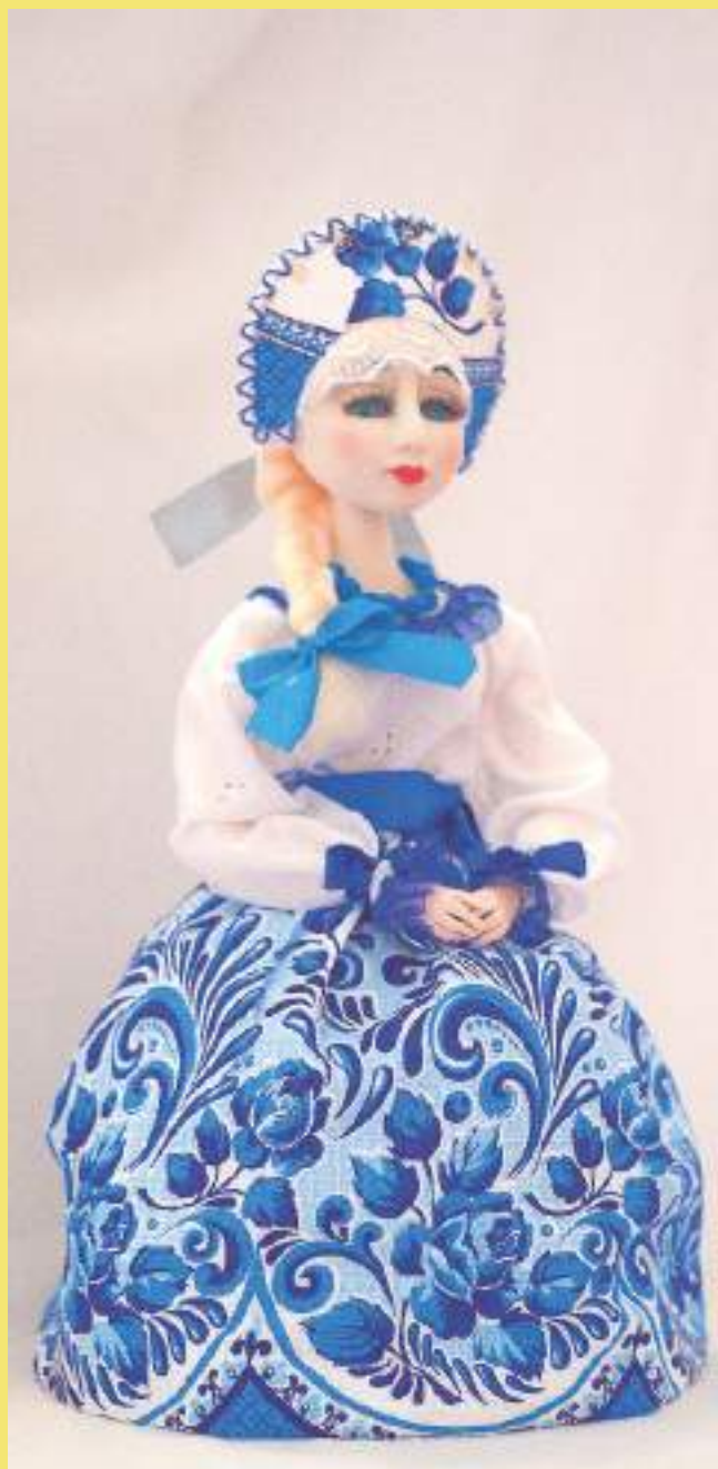
Кукла на чайник, О.В. Митрофанова