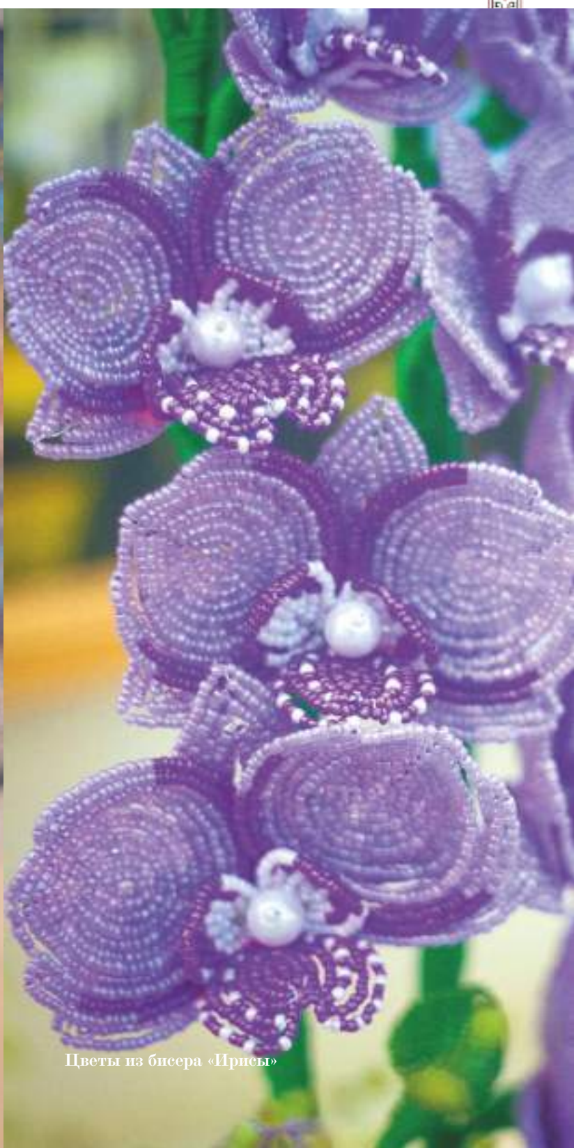
Цветы из бисера «Ирисы»