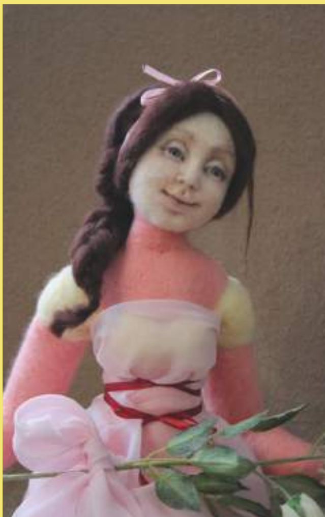
Войковаляние, «Девушка с цветком»