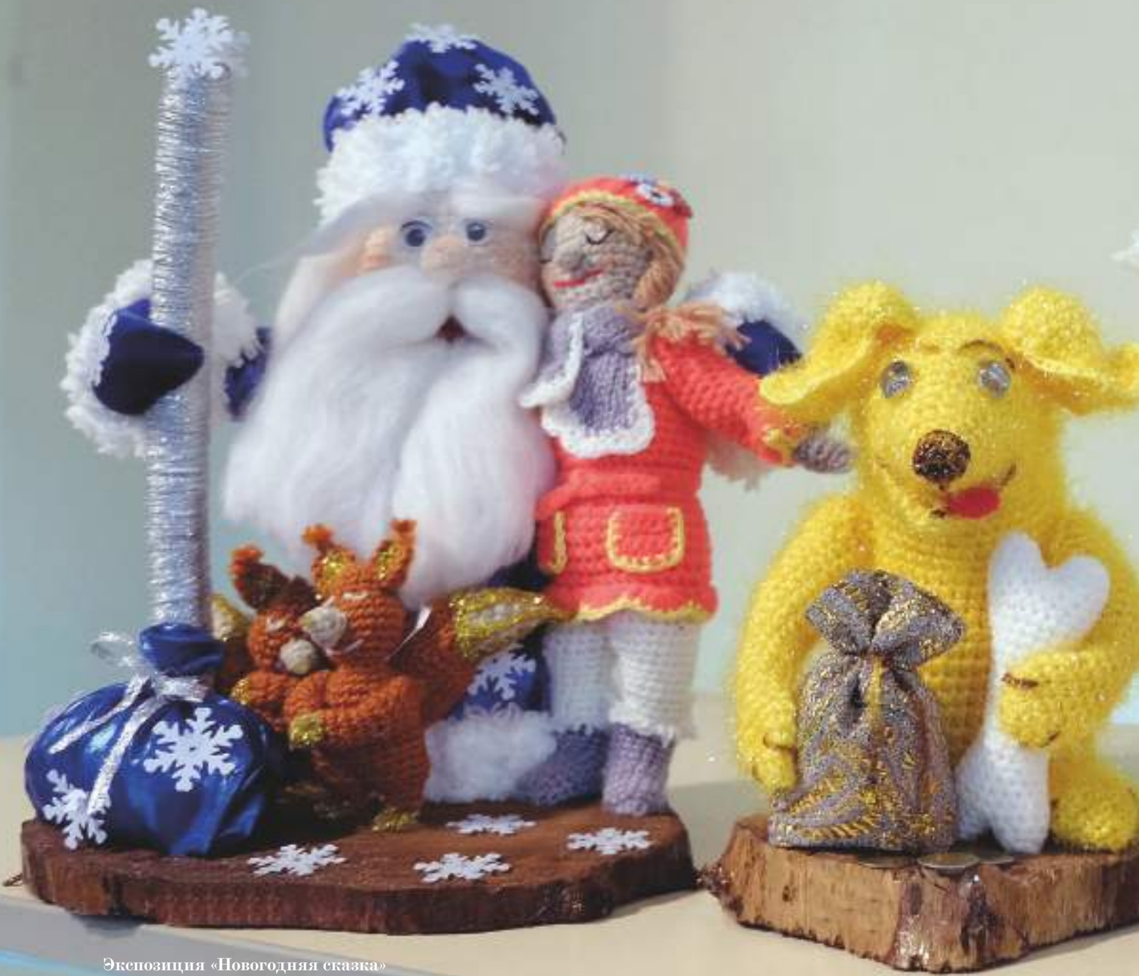
Экспозиция «Новогодняя сказка»