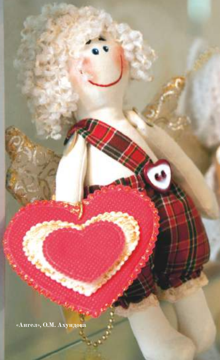
«Ангел», О.М. Ахундова