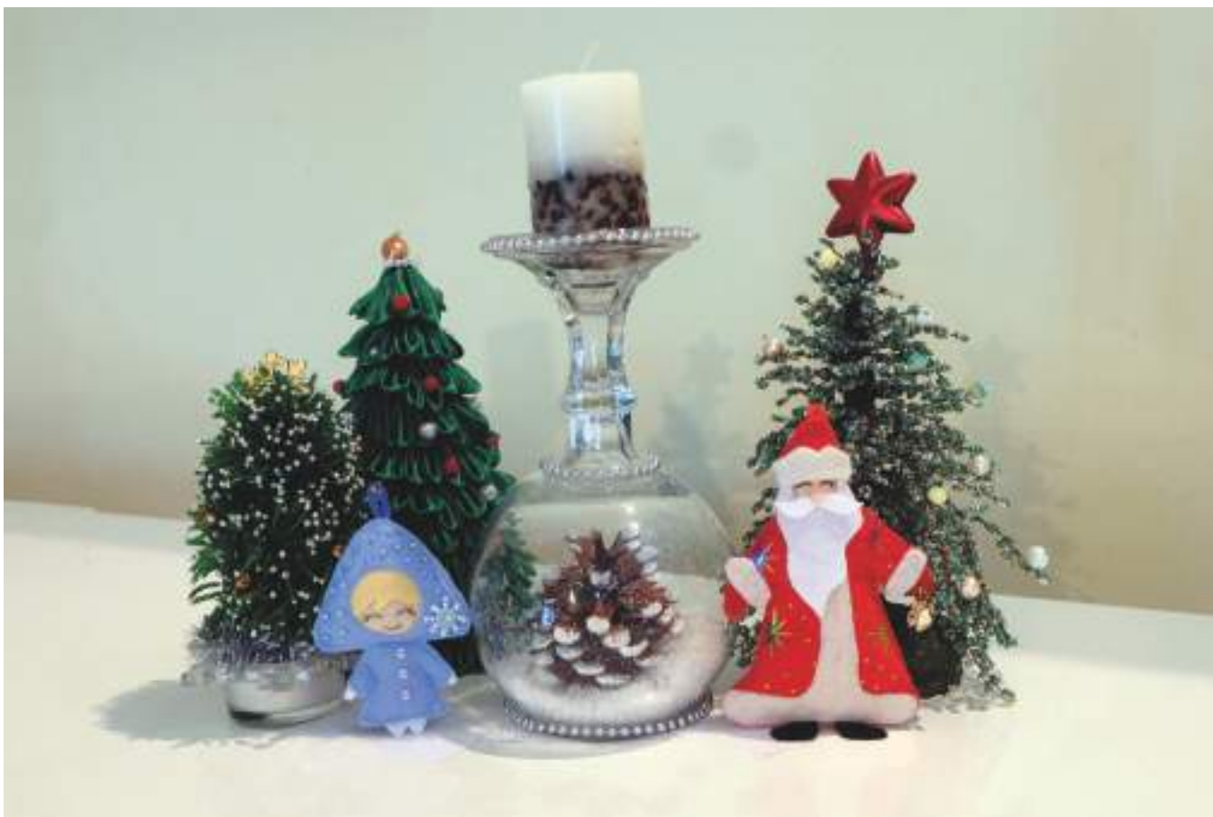
Новогодняя экспозиция из бисера