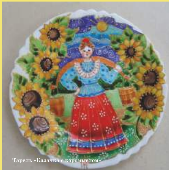
Тарель «Кавказка с коромыслом»