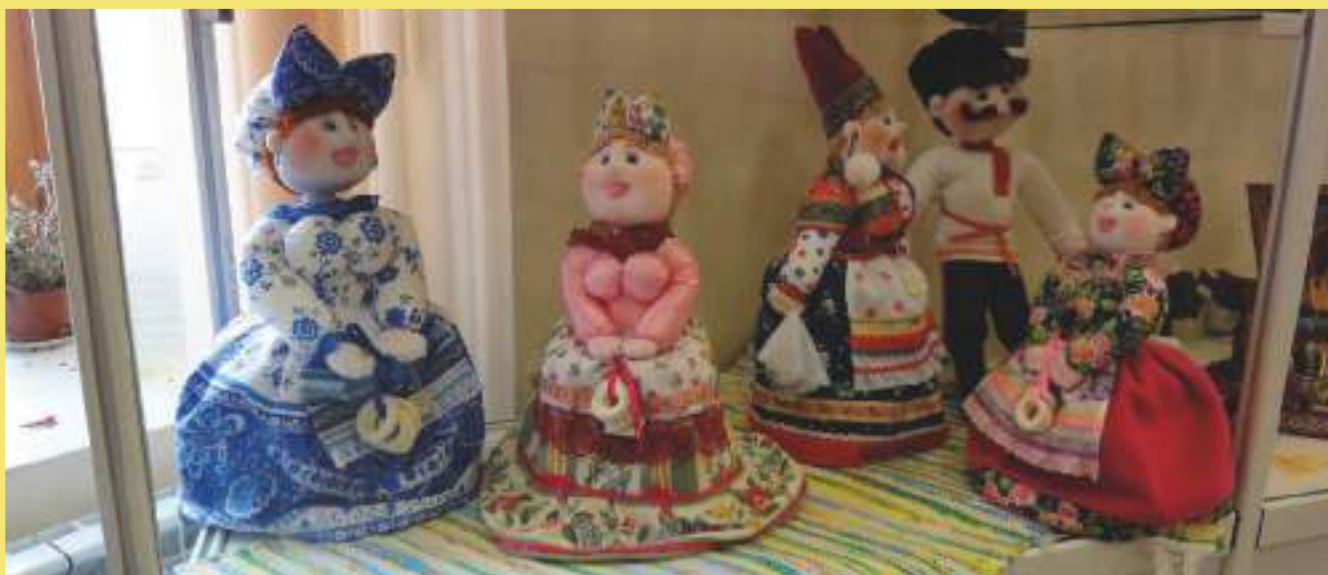
Выставочная экспозиция «Куклы-казачки»