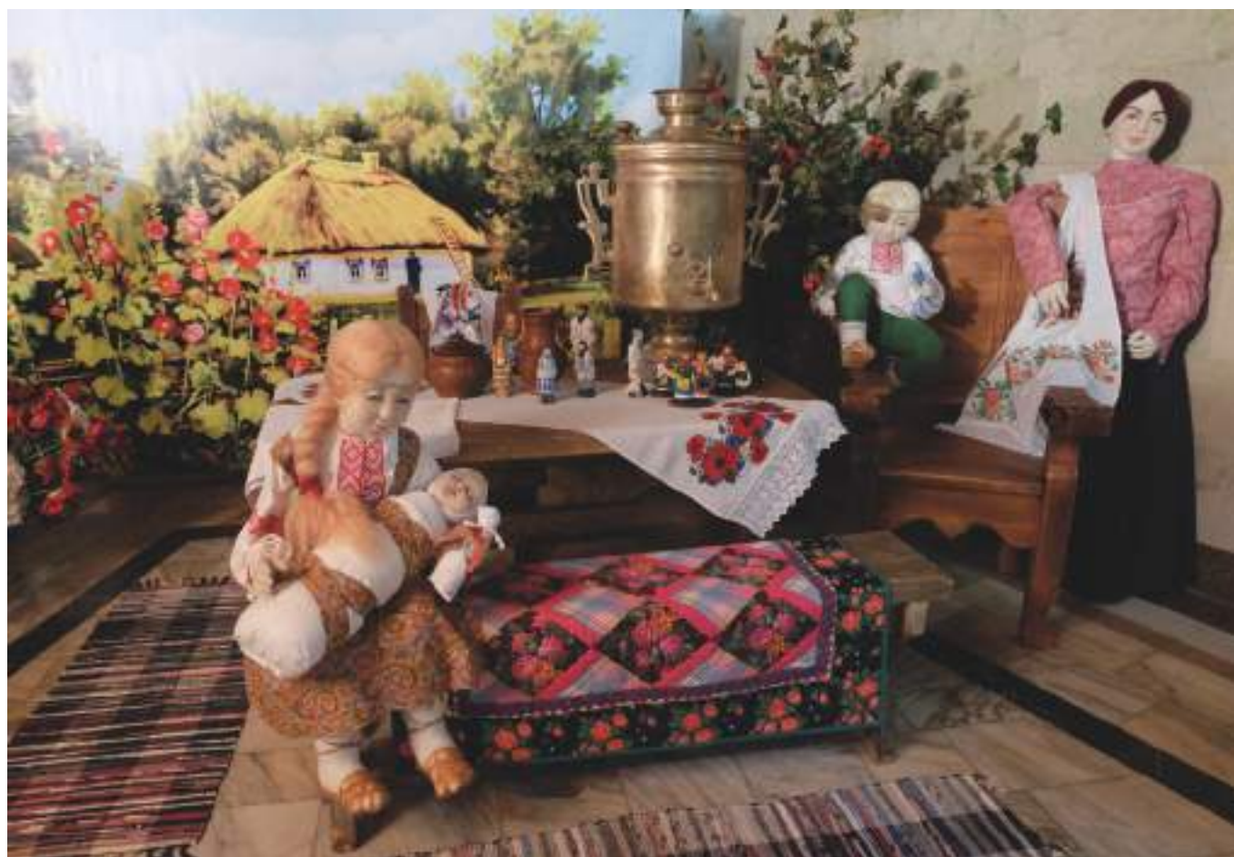
Уголок казачьей хаты