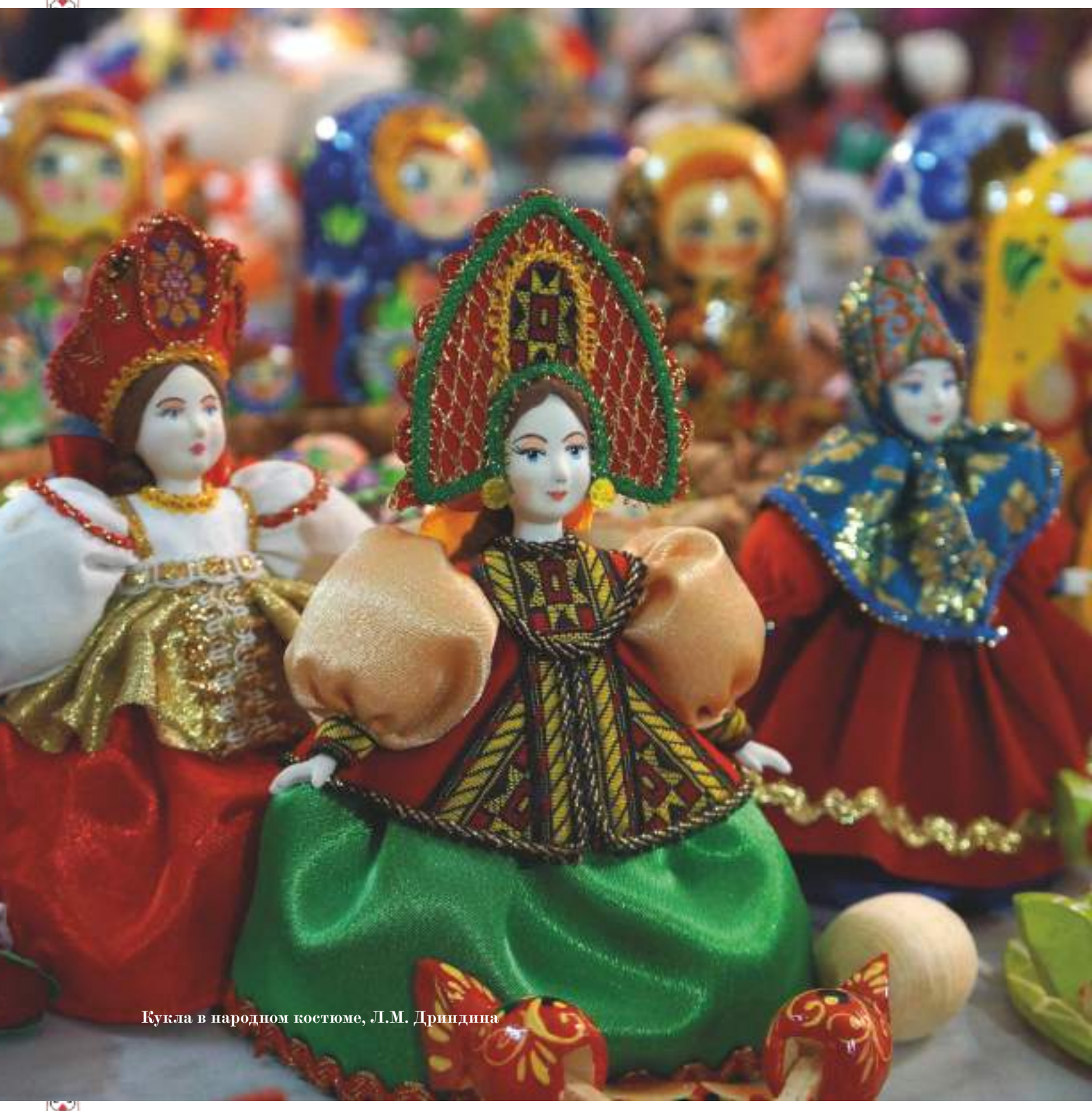
Кукла в народном костюме, Л.М. Дриндина