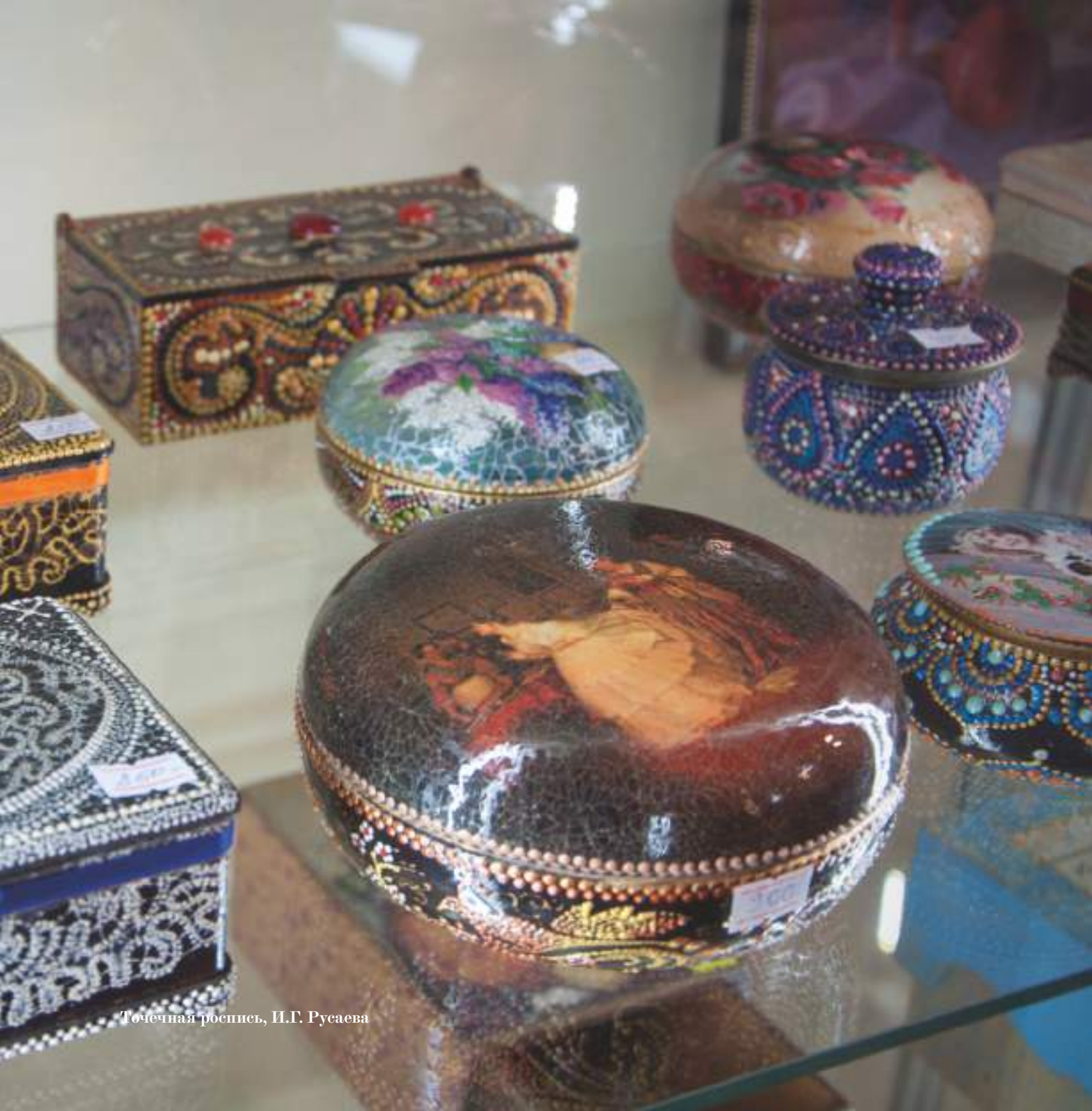
Точечная роспись, И.Г. Русаева