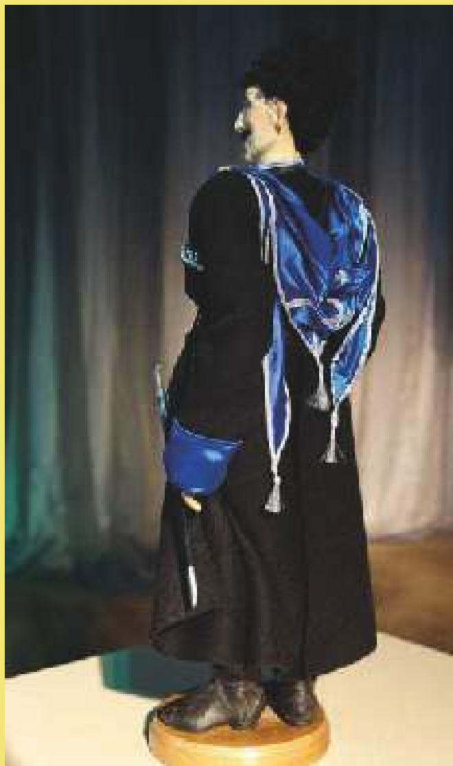
Кукла Терский казак. Фрагмент. Александрова С.Г.