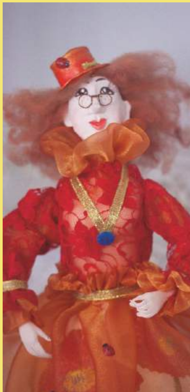
Авторская кукла, Р.Р. Якубова