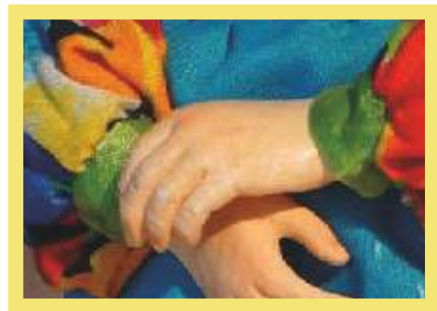
Кукла Некрасовская казачка. Общ. вид. С.Г. Александрова