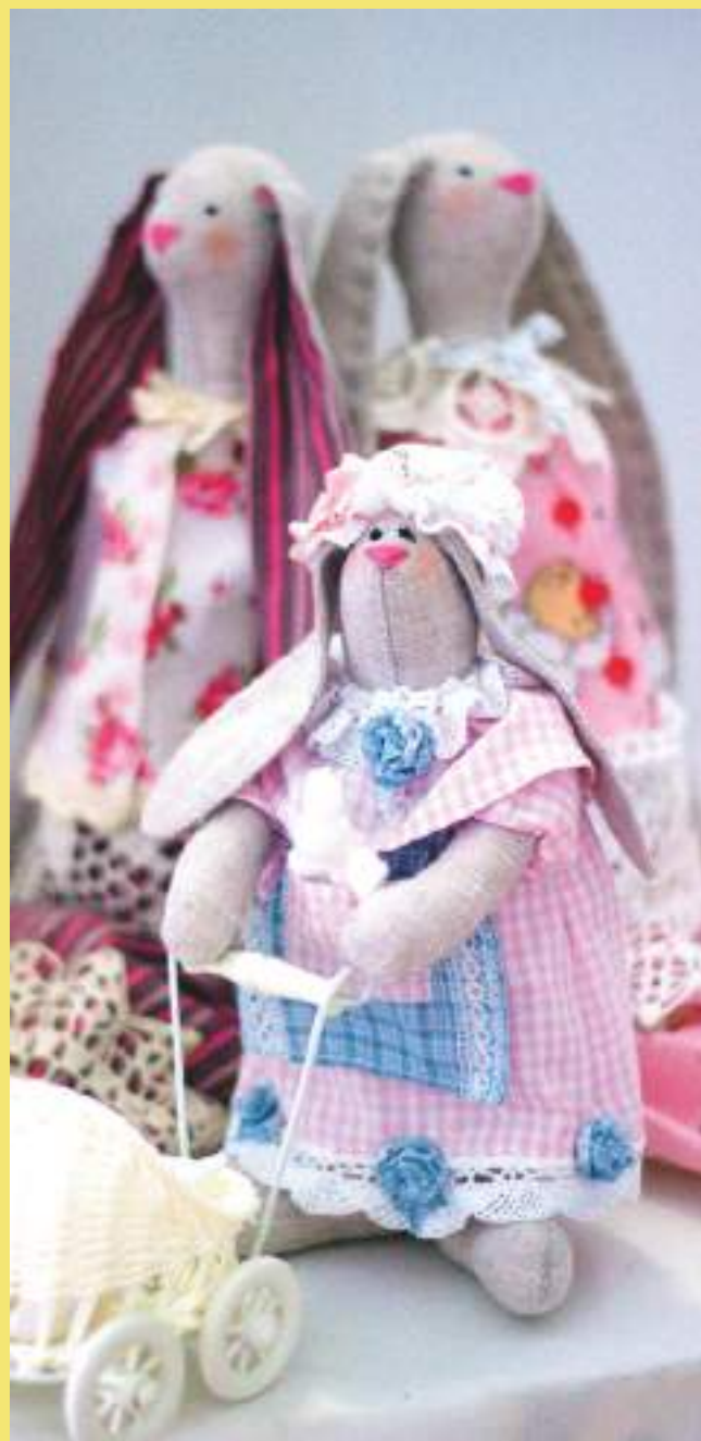
«Зайки», И. К. Подлужная