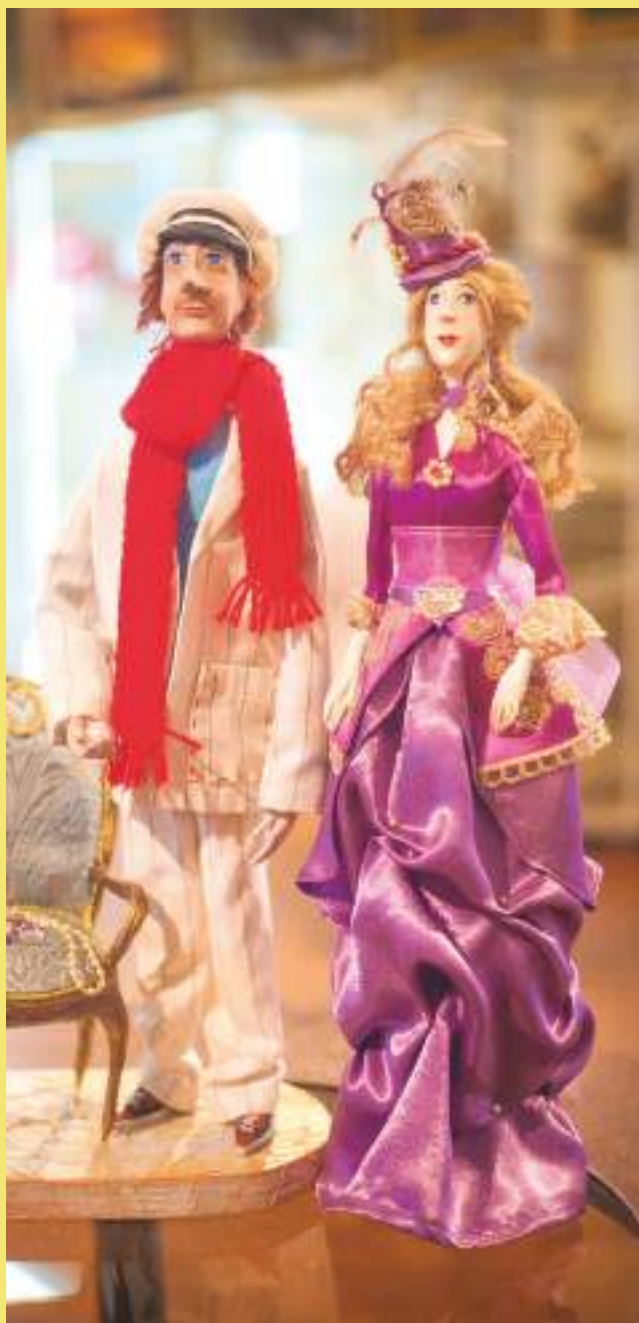
Авторская кукла, Р.Р. Якубова