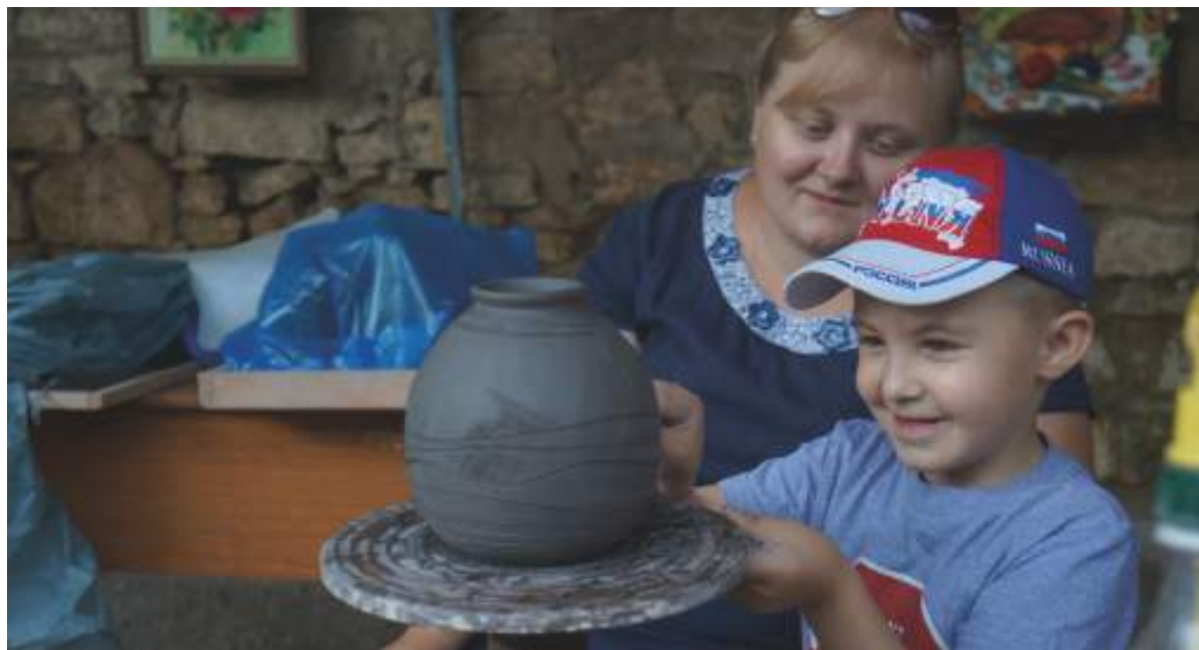
Юные мастера на гончарном круге