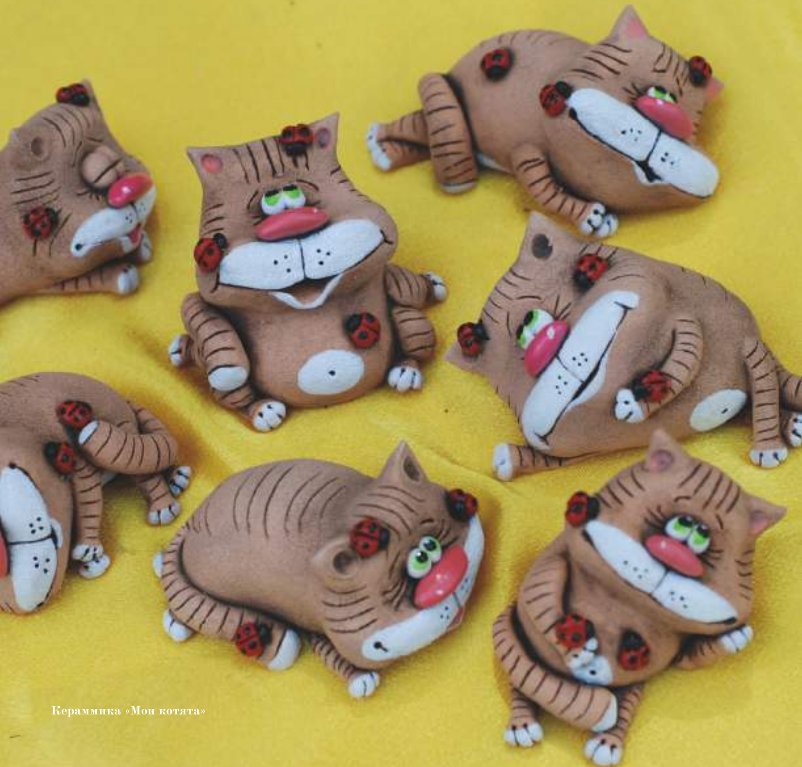
Керамика «Мои котята»