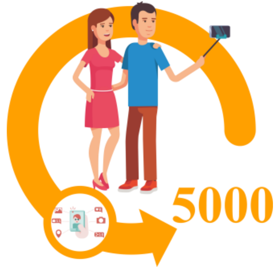
Фото зрителей на фоне эмблемы фестиваля с артистами-любителями, участниками конкурсных программ.