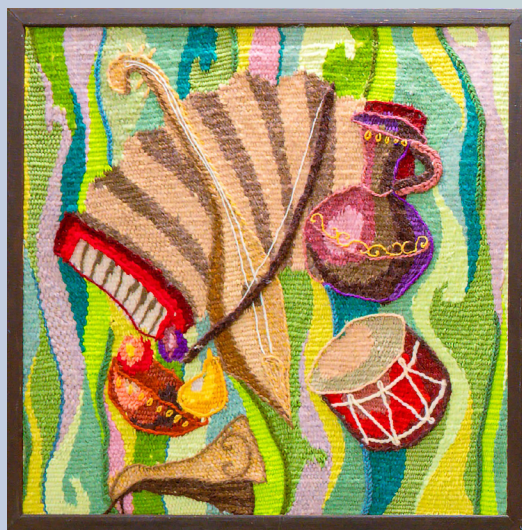
«Ритм» ручное ковроткачество, 52х52