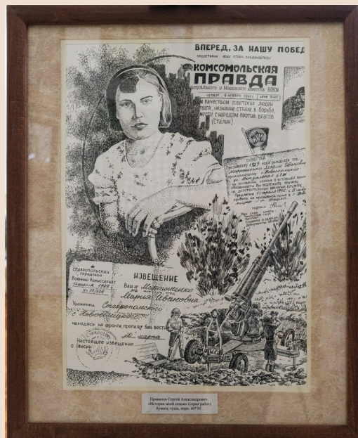
«История моей семьи» бумага/тушь, перо, 40x50