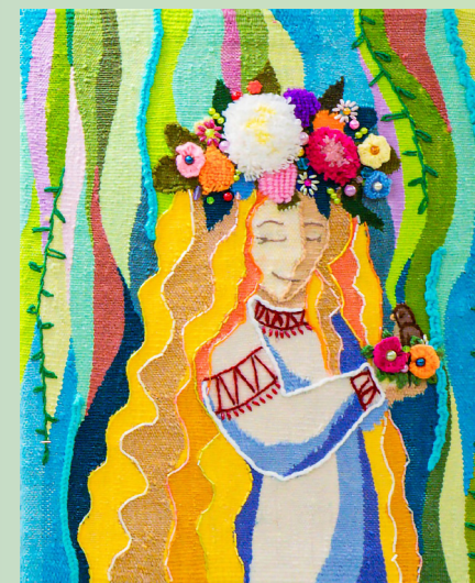
«Дева Весны» ручное ковроткачество, 52х52