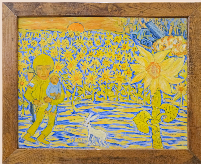
«Слава героям-освободителям» фанера/масло, 50,8x66