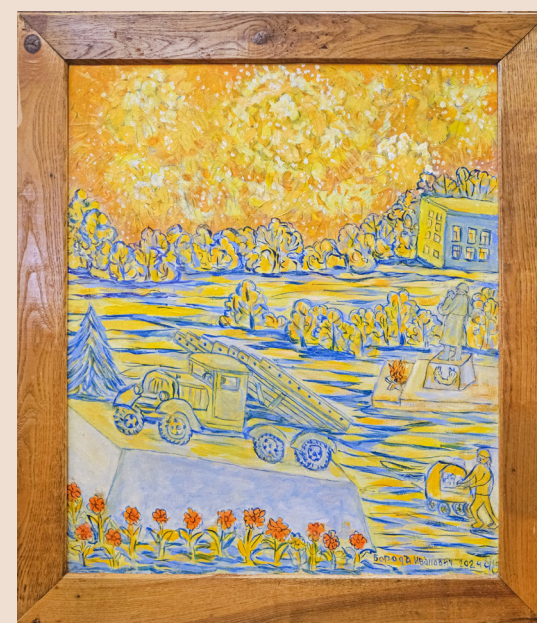
«Парк Победы» двп/масло, 62x52