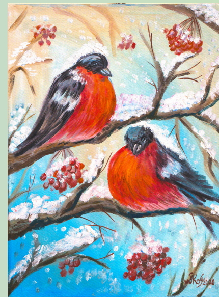
«Снегири» холст/масло, 30х40