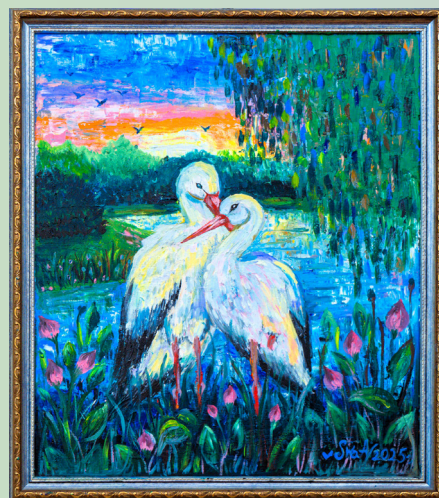
«Аисты» холст/масло, 50х60