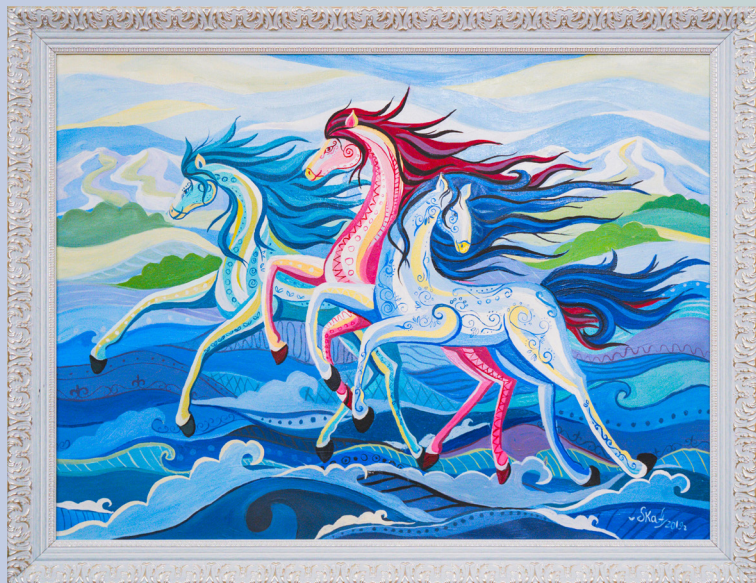
«Свобода» холст/масло, 60х80