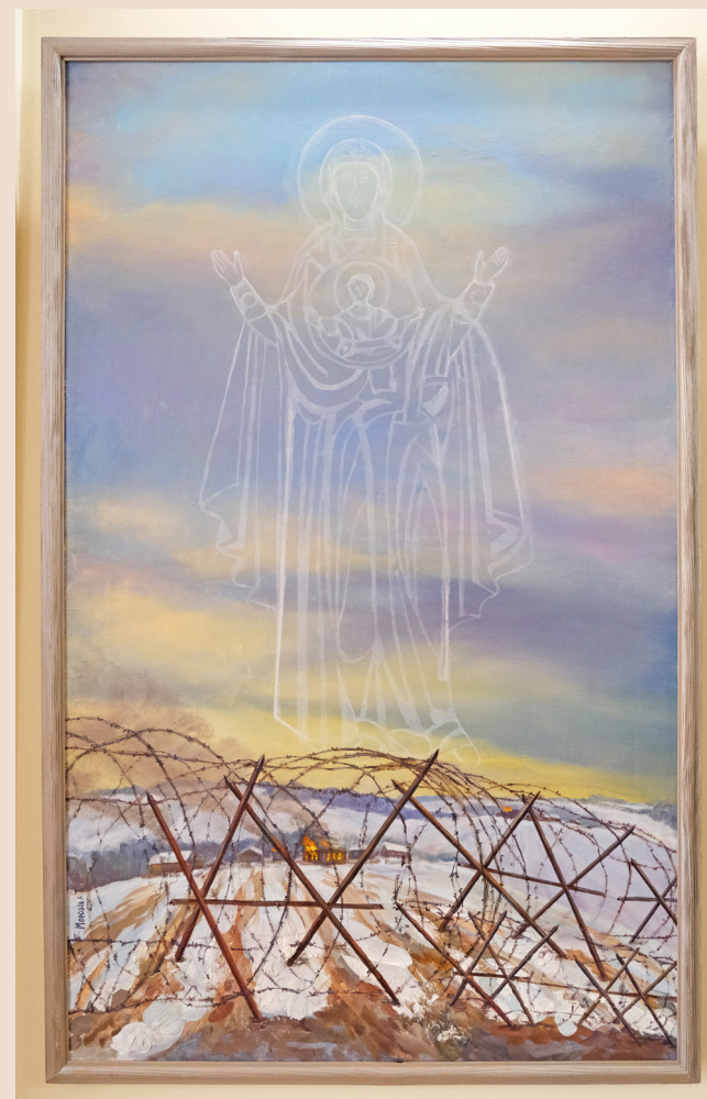
«Нерушимая стена» холст/масло, 100х60