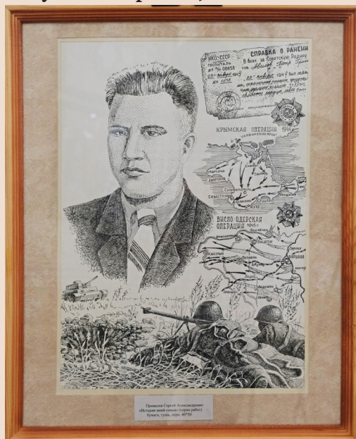
«История моей семьи» бумага/тушь, перо, 40x50