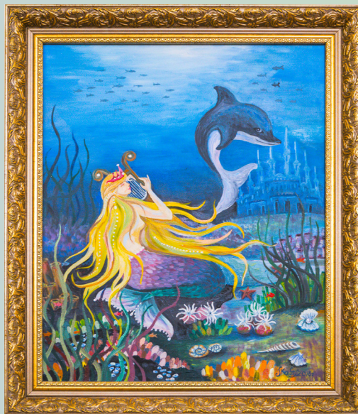
«Мелодия русалки» холст/масло, 40х50