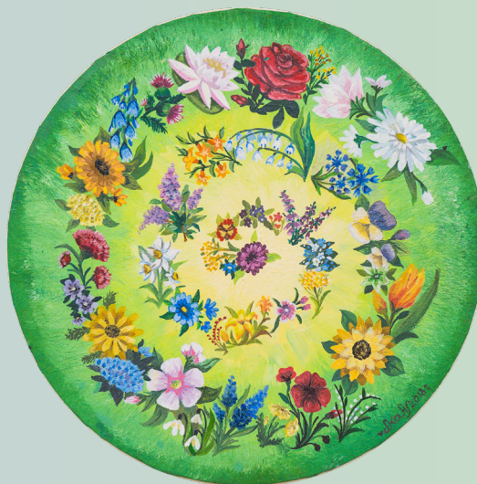
«Цветочный вальс» холст/масло, 40х40