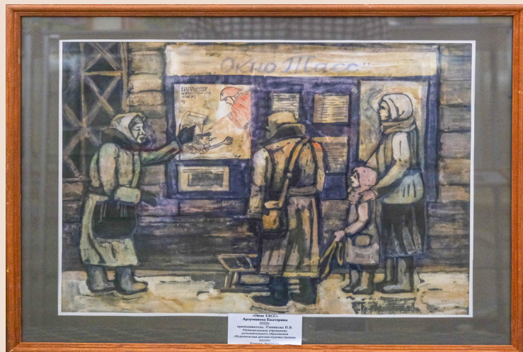
«Окна ТАСС» бумага/чернила, 40x50