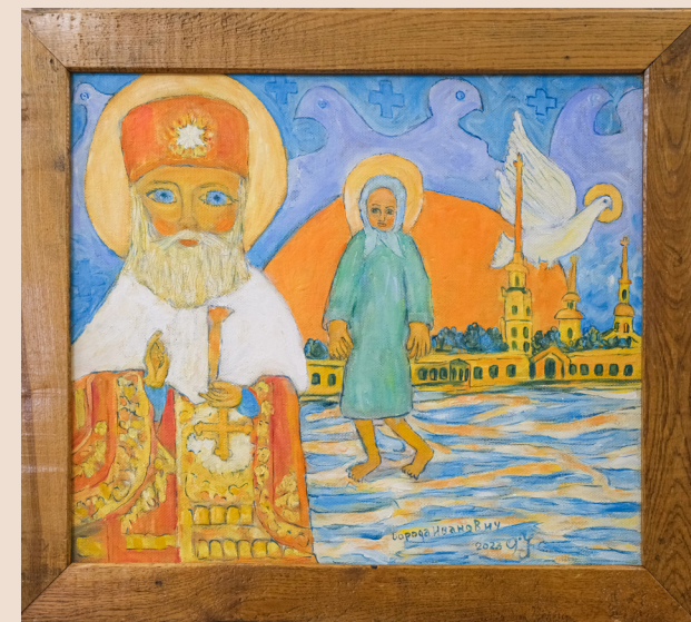
«Николай Чудотворец и Ксения Петербургская» двп/масло, 50x59