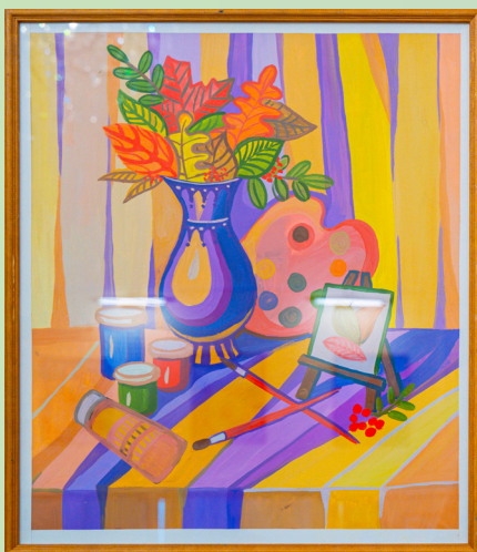
«Осенняя палитра» бумага/гуашь, 60х50

На выставке автором представлены 150 работ, которые экспонируются впервые, это живописные работы с пейзажами родного края, кавказскими, казачьими мотивами. Работы декоративно-прикладного направления выполнены в различных техниках: гобелен, батик, роспись по дереву, роспись по стеклу, войлок, вышивка золотом, крестиком, гладью, вязание спицами и крючком, оригами, лепка, плетение из природных материалов.